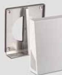
e 90 , dwukierunkowa osłona zewnętrzna 1/HWE-2 lub 1/HAZ-2

Urządzenie ego firmy LUNOS osiąga klasę sprawności energetycznej A według dyrektywy w sprawie ekoprojektu.