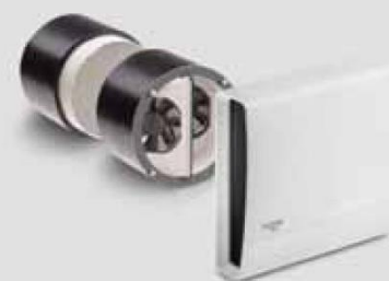
Urządzenie do zabudowy e 90

Produkty i ilustracje mogą się nieznacznie różnić. Ze względu na ciągły rozwój produktu i/lub wielu dostawców, np. surowców, kolory, między innymi, mogą się nieznacznie różnić (poza widocznymi częściami) lub być pokazywane inaczej niż w broszurach.