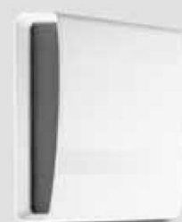
e 90 , dwukierunkowa obudowa wewnętrzna 1/EGI