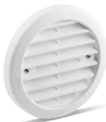
1/WE 115, 1/AZ 115, 1/BE 115 Zewnętrzne zamknięcie plastikowe, okrągłe