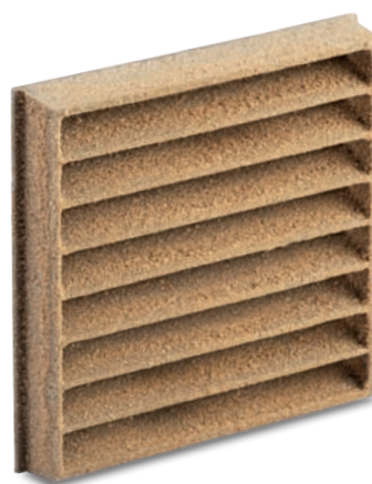
1/J Zewnętrzne zamknięcie piaskowane, do tynkowania plastikowe