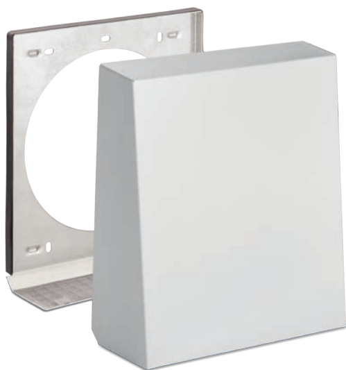
1/HWE 115, 1/HAZ 115 Okap zewnętrzny z izolacją akustyczną z aluminium

Kratki zewnętrzne do urządzeń jednokanałowych o średnicy 100 mm ( do e 2 mini) posiadają dodatkową moskitierę w komplecie zabezpieczającą przed dostaniem się owadów do pomieszczenia.